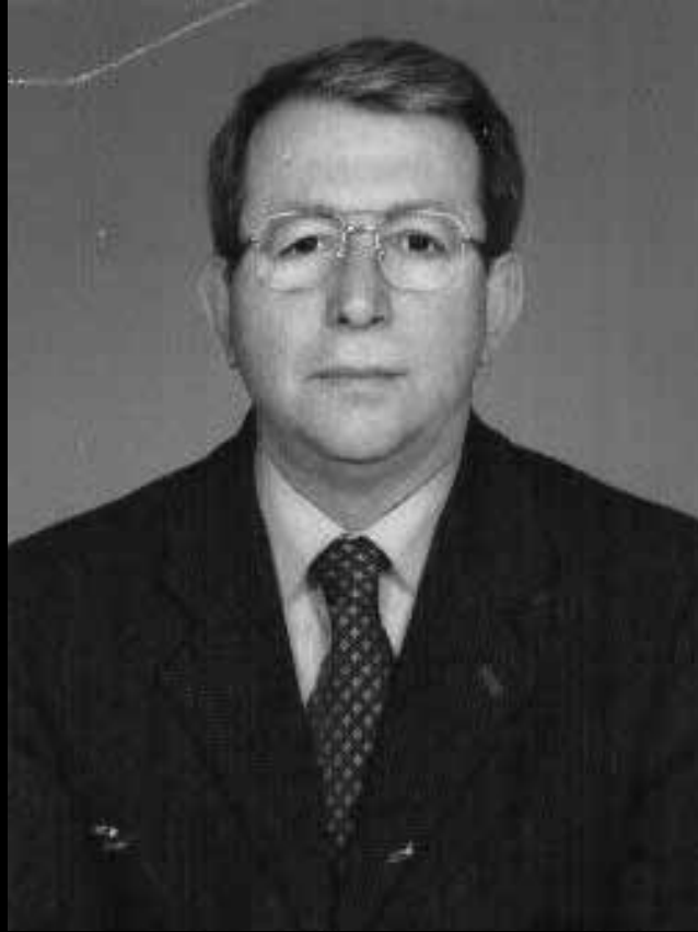
Av. Hasret Muhteşem GÜVEN